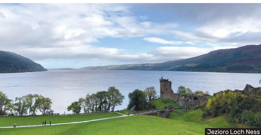
Jezioro Loch Ness

Mając więcej czasu, także miejscowym autobusem można pojechać za miasto i zwiedzić piękną kaplicę Rosslyn, znaną z „Kodu Da Vinci”. Dla chętnych aby poznać dalsze zakątki