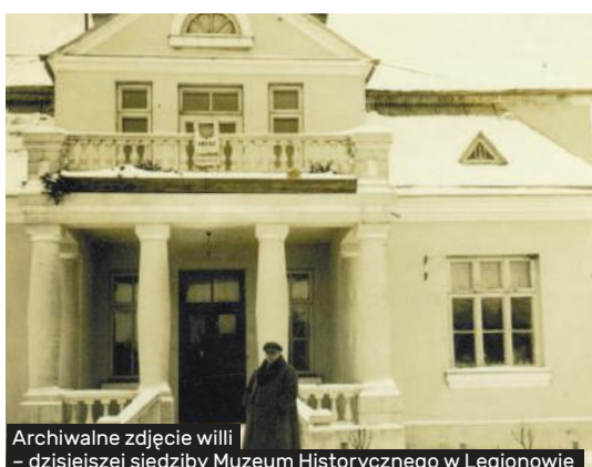
Archiwalne zdjęcie willi – dzisiejszej siedziby Muzeum Historycznego w Legionowie

Początki Muzeum Historycznego w Legionowie sięgają 10 listopada 2001 r. kiedy utworzone zostały Zbiory Historyczne Miasta Legionowo będące komórką Wydziału Kultury i Promocji Urzędu Miasta Legionowo.