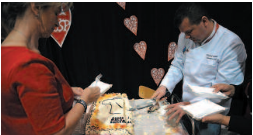
Tort Akademii Młodego Smakosza najwyższej wylicypowanym „przedmiotem” podczas tegorocznego finału WOSP

Uchwyciłeś śmieszny/wzruszający moment, piękny krajobraz lub po prostu chwilę, która jest dla Ciebie ważna? A może w domowym archiwum znalazło się zdjęcie, które pokazuje jak kiedyś wyglądało nasze miasto? Prosimy przesyłać swoje zdjęcia z Legionowa na adres rzecznik@um.legionowo.pl . Najlepsze fotografie zaprezentujemy w rubryce „Zdjęcie Miesiąca”. Przesłanie zdjęcia oznacza wyrażenie zgody na jego publikację. W przypadku zdjęć przedstawiających osoby – prosimy o dołączenie ich danych oraz zgody na publikację. ■