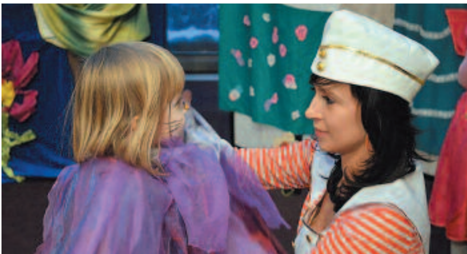
Na dzieci czekało wiele atrakcji

Dzieci, które przysły wesprzeć kolegę mogły pomalować sobie buzię, przebrać się w jeden z bajkowych kostiumów, zagrać w grę