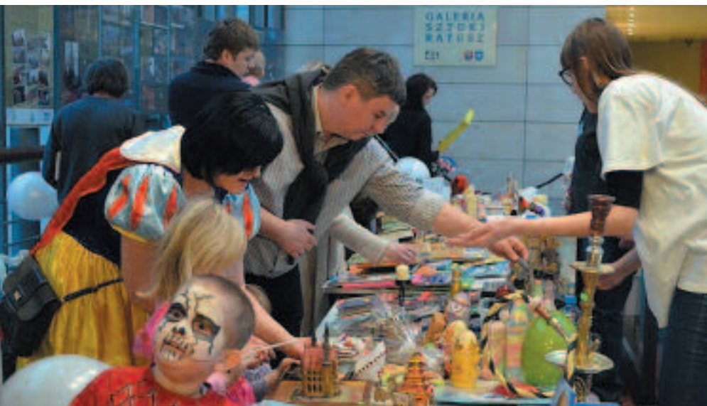
Mieszkańcy przekazali wiele przedmiotów na aukcję