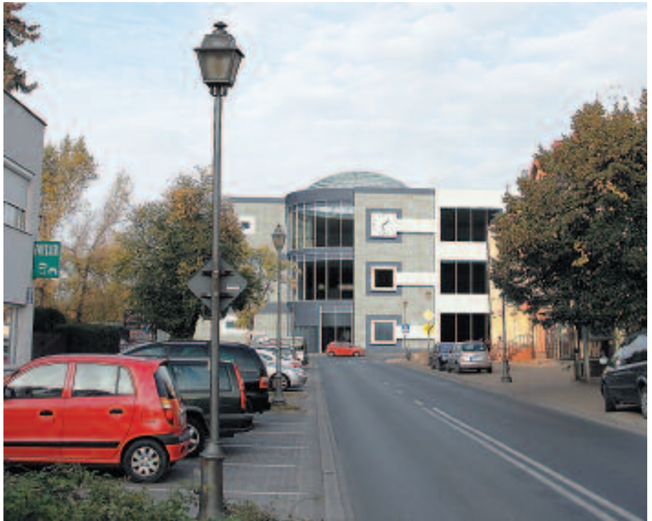
Centrum Komunikacyjne będzie także główną siedzibą Mediateki

W skład tej największej w historii miasta inwestycji wejda: dworzec, parking, połączenie drogowe ulic Polna i Piaskowa. W ramach