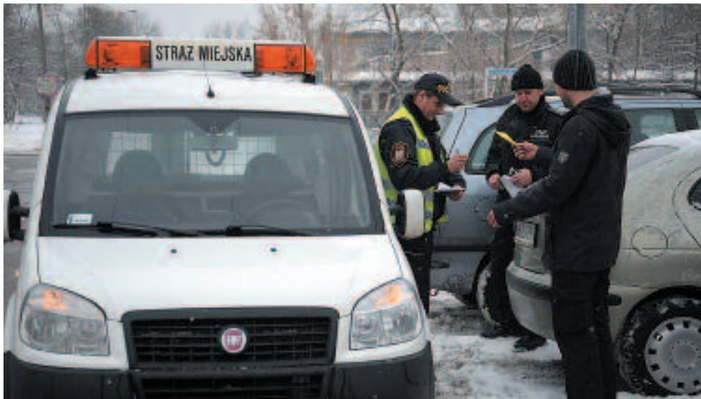
Strażnicy nie tylko karzą, ale przede wszystkim upominają i ostrzegają

W 2012 roku koszt utrzymania Straży Miejskiej, wraz z inwestycją jaką był zakup samochodu, wyniósł: 4 808 424,25 zł (wraz z wynagrodzeniem strażników brutto – 1 494 311,66 zł), w tej kwocie zawiera się również koszt funkcjonowania monitoringu – 107,5 tys. zł (bez kosztów zatrudnionych tam 14 osób). W bieżącym roku planowana kwota na funkcjonowanie Straży to 2 340 344,00 zł, w tym na monitoring – 138 tys zł (stan na 11.02.2013 r. bez kosztów zatrudnionych tam 14 osób). ■