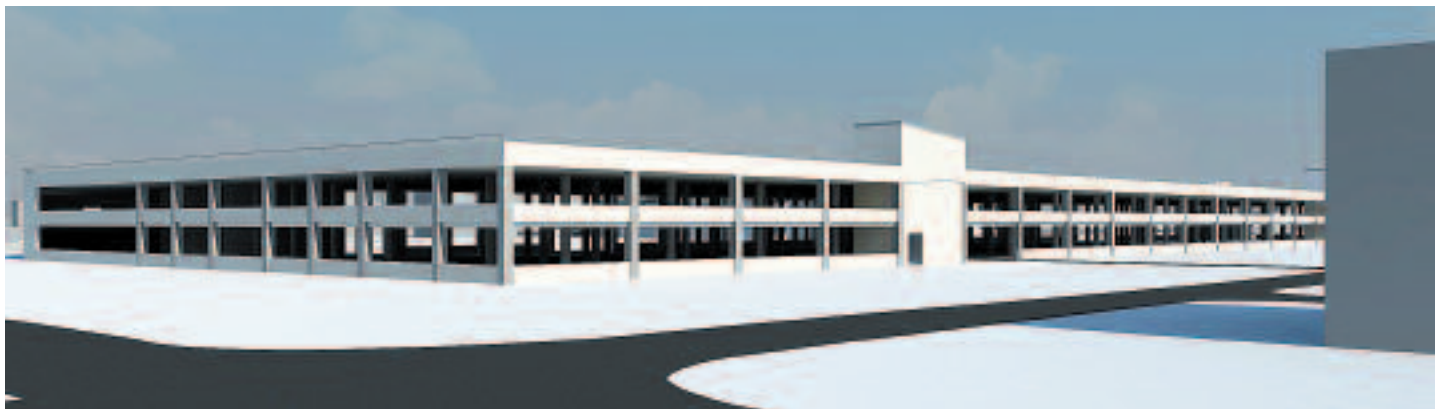
Trzykondygnacyjny parking pomieści blisko 800 aut