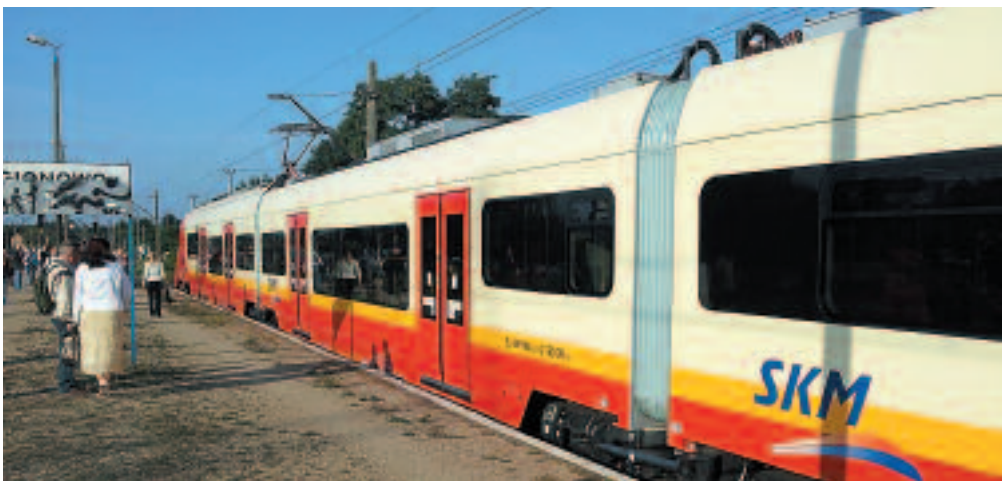
ZTM w ciągu zaledwie dwóch lat podniósł koszty „wspólnego biletu” dla Legionowa o 500%

Na dzień dzisiejszy wiadomo, że mieszkańcy Legionowa posługując się kartą miejską będą mogli nadal podróżować na trasie PKP Legionowo – Warszawa (pociągami Kolei Mazowieckich) bez dodatkowych opłat. Chcąc zmniejszyć wysokość podwyżki dotacji dla ZTM-u, rozważane jest jednak ograniczenie zasięgu „wspólnego biletu” tylko do stacji głównej Legionowo, z której korzysta 1,5 tysiąca pasażerów dziennie więcej, niż ze stacji: Przystanek. Rekompensata dla pasażerów korzystających ze stacji „Legionowo – Przystanek” byłaby większa liczba kursów bezpłatnego autobusu dowozowego. Ze stacji Legionowo z Kolei Mazowieckich korzysta dziennie prawie dwa tysiące osób, a ze stacji Legionowo Przystanek 600. To duże dyspro-