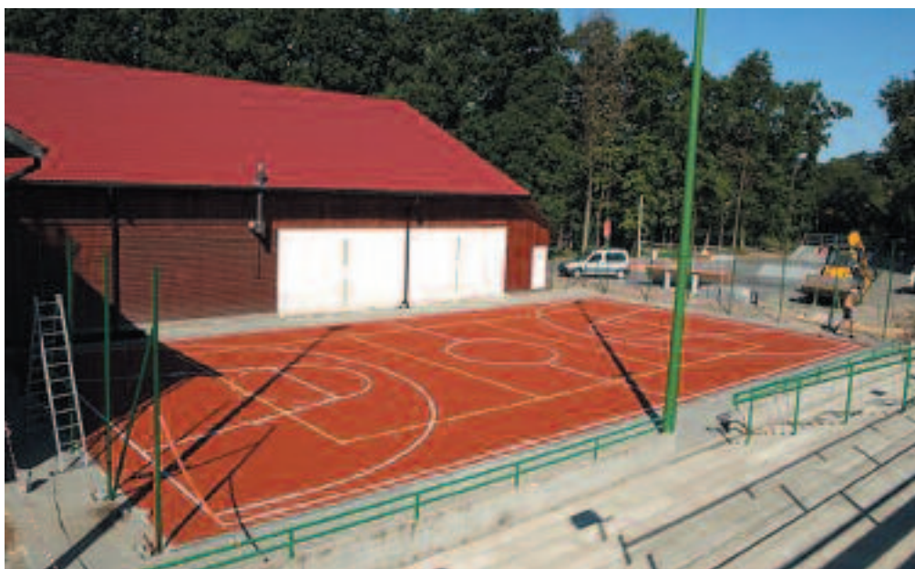
Nowa spółka będzie zarządzała m.in. stadionem miejskim