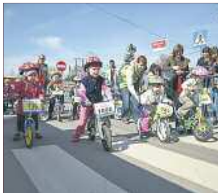
▲ Poland Bike także dla najmłodszych