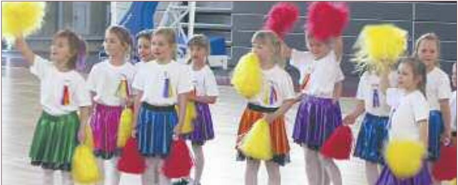
▲ Legionowskie podstawówki gotowe są na przyjęcie najmłodszych uczniów