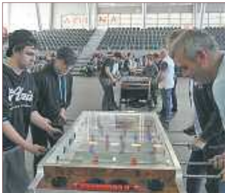
▲ Piłka nożna na stolikach, a czerwcem na stadionie

W piłkę nożną można grać na boiskach, parkietach sal, a nawet aktywnie kibicować przed telewizorem. Mieszkańcy Legionowa lubią grać na stołach. Pokazali to 25 marca w Arenie, podczas I Wielkiego Otwartego Turnieju Futbolu Stołowego.