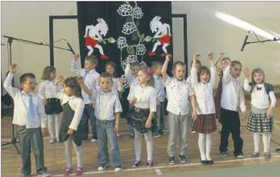
▲ Zespoły szkół mają uzasadnienie ekonomiczne, usprawniają także funkcjonowanie placówek

Legionowską oświatę od września czeka szereg drobnych, ale zasadniczych zmian. Utworzyliśmy nowe zespoły szkół, trwają konkursy na ośmiu dyrektorów szkół i przedszkoli, a godziny pracy przedszkoli zostaną zmienione zgodnie z zapotrzebowaniem mieszkańców. Jeszcze w marcu rozpoczęła się seria spotkań informacyjnych dla rodziców tegorocznych sześciolatków, pomagających podjąć decyzję pomiędzy przedszkolem a szkołą.