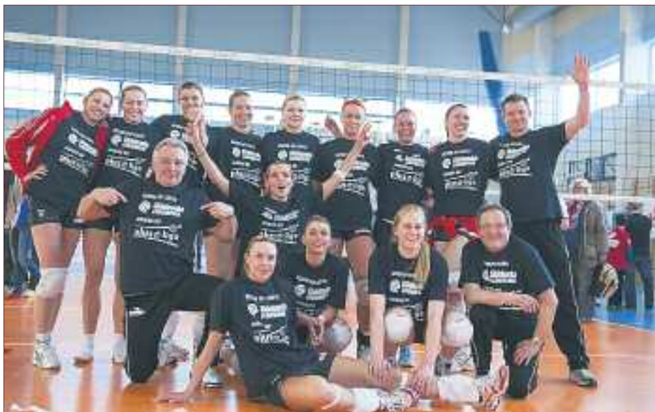
▲ Zaledwie dwa sezony zajęło LTS Legionovii dojście na szczyt

Tylko dwa lata zajęło legionowskiemu siatkarskiemu awansowanie z końca 2 ligi do PlusLigi. Legionowo nigdy nie miało drużyny grającej na tym poziomie w grach zespołowych, jesteśmy też jedynym miastem na Mazowszu, mogącym pochwalić się żeńskim siatkarskim zespołem w najwyższej klasie rozrywkowej.