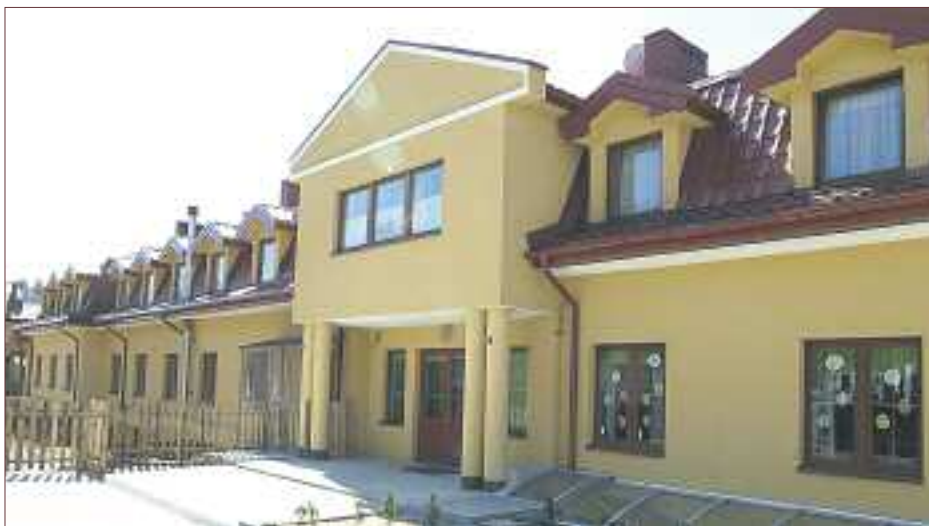
▲ Przeronane sale przedszkola już we wrześniu przyjmą pierwszych wychowanków