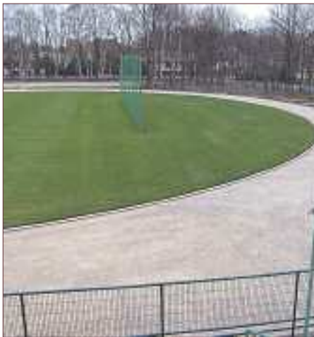
▲ Bieżnia będzie miała nowoczesną i wytrzymałą nawierzchnię