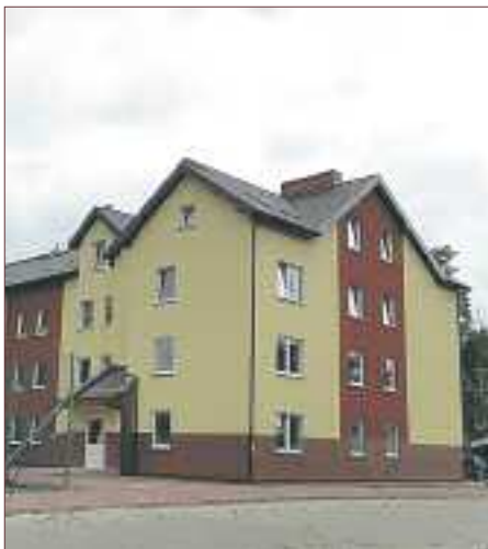
▲ W nowym budynku zamieszka 40 rodzin