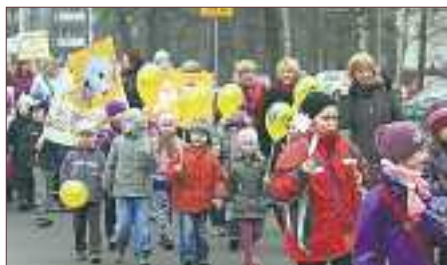
▲ Od najmłodszych lat obowiązuje zasada fair play

Tydzień później dzieci z legionowskich Przedszkoli Miejskich zorganizowały w Arenie Legiono-