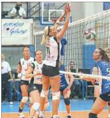
▲ Zespół jak burza przeszedł przez I ligę

Lecz siatkarki to niejedynie mistrzynie minionych tygodni – do pierwszej ligi w pięknym stylu awansowali panowie z KPR Legionowo.