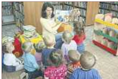
▲ Biblioteka przyciąga najmłodszych czytelników

Oferta legionowskiej Biblioteki dla najmłodszych jest niezwykle szeroka – na dzieci czeka kolorowo urządzony kącik, w którym nie tylko można obejrzeć książki, lecz także pobawić się i odpocząć na wygodnych poduszkach. Jest to ulubione miejsce legionowskich przedszkolaków i uczestników Tęczowego Klubiku Małego Czytelnika. Ponieważ czytelnika należy edukować od najmłodszych lat, Biblioteka regularnie odwiedza miejski żłobek, a przedszkolaki uczęszczają na organizowane w placówce przedstawienia i spektakle. Najmłodszy mieszkańcy tłumnie zgłaszają prace na organizowane konkursy – na konkurs „Malo-